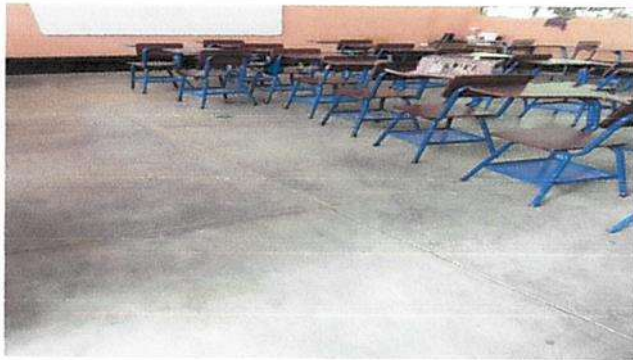
Foto1: Colocacion de piso de granito ✓